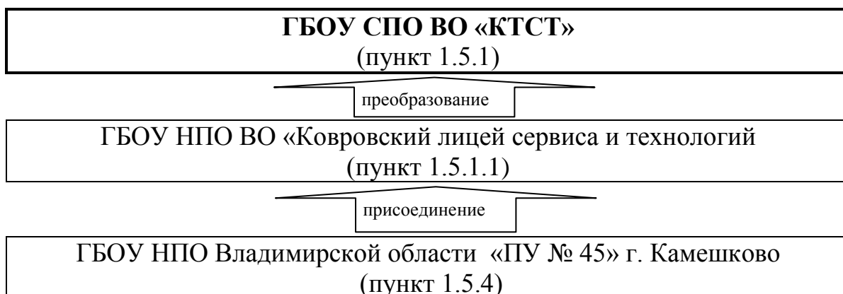
Схема реорганизации №2: